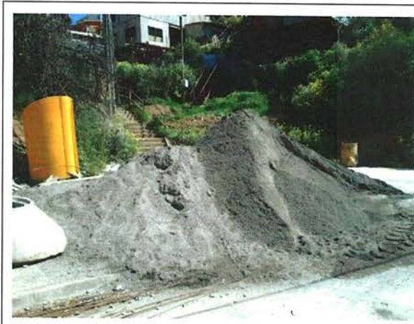
Fotografía N°5 – 12/11/2015: Acopio de material en condiciones distintas a las especificadas