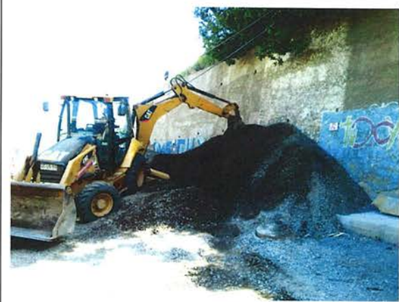
Fotografía N°7 – 17/11/2015: Falta señalización vial que informe sobre la interrupción del tránsito peatonal en el sector indicado en el plano de esquema de trabajos etapa III