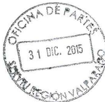
VICTOR HUGO MERINO ROJAS Contralor Regional Valparaíso CONTRALORÍA GENERAL DE LA REPÚBLICA