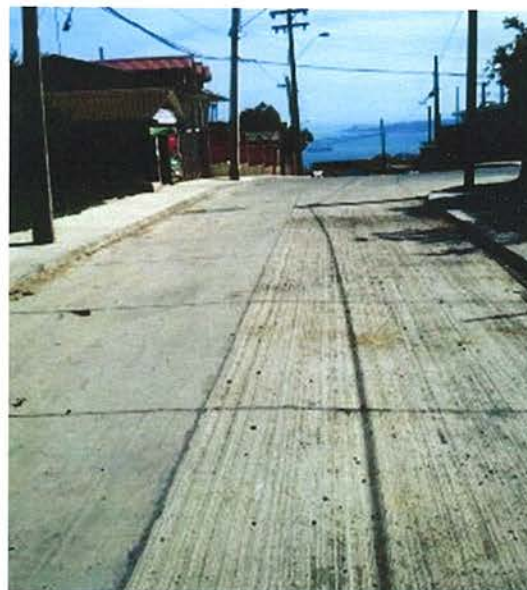
Fotografía N°1 – 12/11/2015: Diferencias en la rugosidad superficial de pavimentos