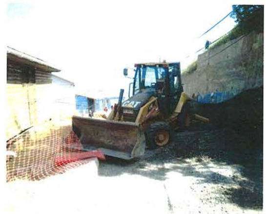
Fotografía N° 6 – 17/11/2015: Falta señalización vial que informe sobre la interrupción del tránsito peatonal en el sector indicado en el plano de esquema de trabajos etapa III