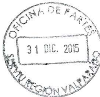
VICTOR HUGO MERINO ROJAS Contralor Regional Valparaíso CONTRALORÍA GENERAL DE LA REPÚBLICA