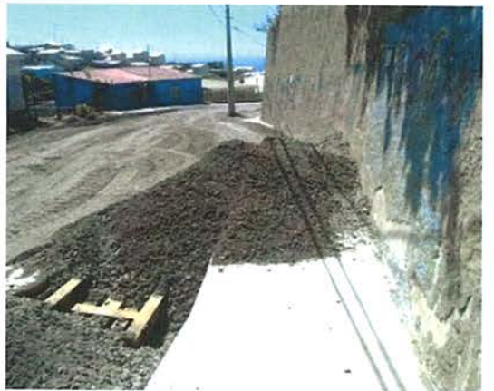
Fotografía N°8 – 12/11/2015: Falta señalización vial que informe sobre la interrupción del tránsito peatonal en el sector indicado en el plano de esquema de trabajos etapa III.